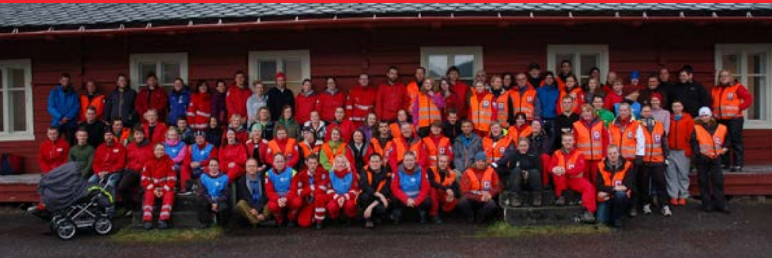
Bildet: Denne flotte gjengen deltok på fjorårets regionskurs