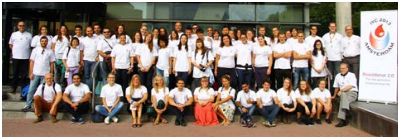
Bildet: Alle deltagerne på «Bloddoner 2.0»