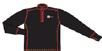
GLIDELÅSPOLO Uts.pris 849,- RØDE KORS PRIS 399,-

I samarbeid med klesprodusenten Janus AS, har Røde Kors Førstehjelp utviklet en kolleksjon som er testet av svært erfarne mannskaper i redningstjenesten i Røde Kors.