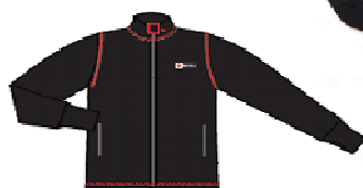
JAKKE MED LOMMER Uts.pris 989,- RØDE KORS PRIS 549,-